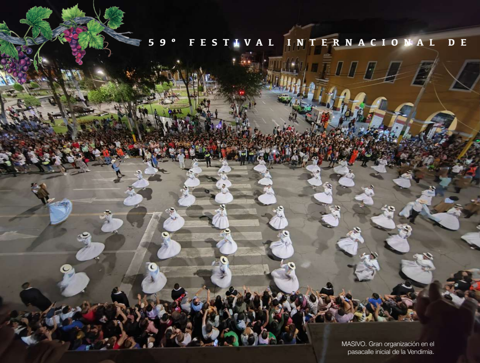
MASIVO. Gran organización en el pasacalle inicial de la Vendimia.