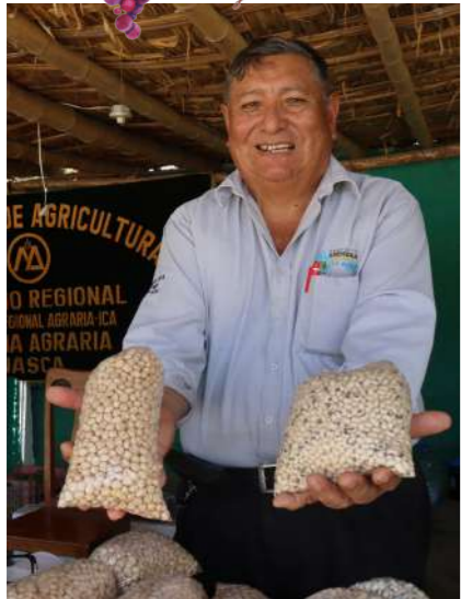
FERIA AGRÍCOLA DE LA VENDIMIA