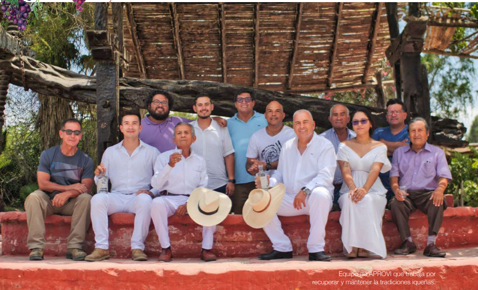
Equipo de APROVI que trabaja por recuperar y mantener las tradiciones iqueñas.

ASOCIACIÓN DE PRODUCTORES VITIVINÍCOLAS DE ICA - APROVI