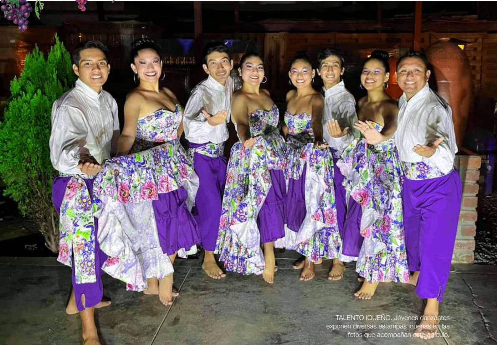
TALENTO IQUEÑO. Jóvenes danzantes exponen diversas estampas iqueñas en las fotos que acompañan este artículo.