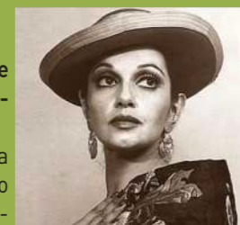
ALICIA MAGUIÑA (1938-2020), renombrada compositora nacional, cantó a Ica, donde pasó su infancia.

-Si bien es cierto que en la Vendimia no se ha hecho antes las estampas iqueñas, muchos colegios ya lo venían haciendo desde tiempo atrás, se hacían concursos regionales a través del Ministerio de Educación, que valorara que esas tradiciones se expresaran a través de la danza.