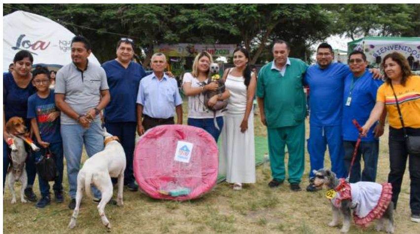
CONCURSO CANINO DE LA VENDIMIA

“Es importante participar en la Vendimia, es una oportunidad de ofertar productos directamente del campo al consumidor a precios bajos y de difundir las bondades de nuestra producción agropecuaria”, puntualiza el ingeniero Geldres. Un evento que estará los 10 días de la Vendimia. 🍷