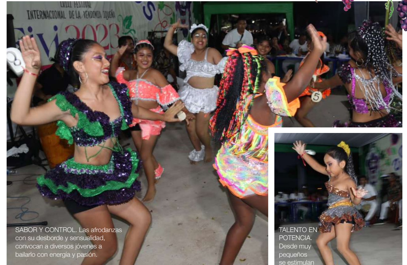
SABOR Y CONTROL. Las afrodanzas con su desborde y sensualidad, convocan a diversos jóvenes a bailarlas con energía y pasión.