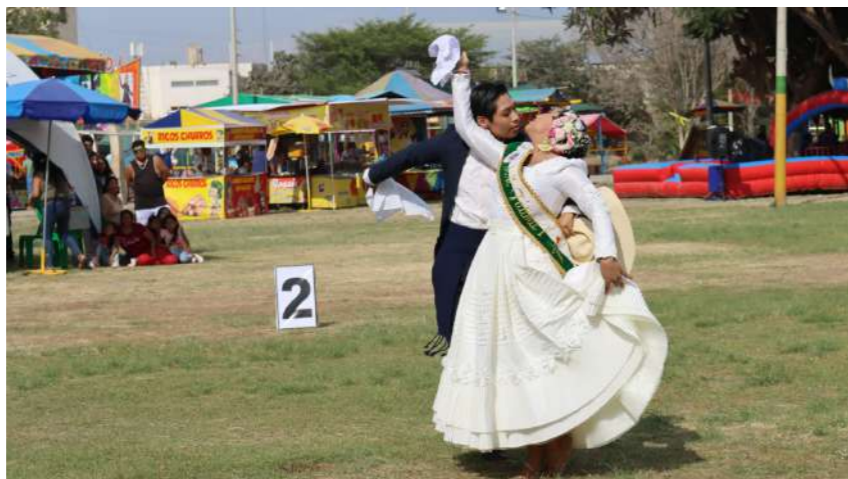
ELEGANCIA. Pareja ganadora del Concurso de Marineria de la Vendimia 2023.

Durante muchos años, el tradicional baile norteño ha ganado adeptos entre la niñez y la juventud. Los seduce su elegancia, salero y ritmo. Nos pasa a todos, sucede que nos detenemos de nuestras actividades diarias cuando escuchamos ese redoble de tambores y el repiqueteo de las guitarras, y al instante, paramos las orejas y no dejamos de seguir el ritmo con los pies de este baile que encanta tanto, además de sus bellos y majestuosos trajes llenos de bordes y encajes y un pañuelo que no deja de agitarse nunca.