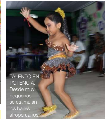
TALENTO EN POTENCIA. Desde muy pequeños se estimulan los bailes afroperuanos.