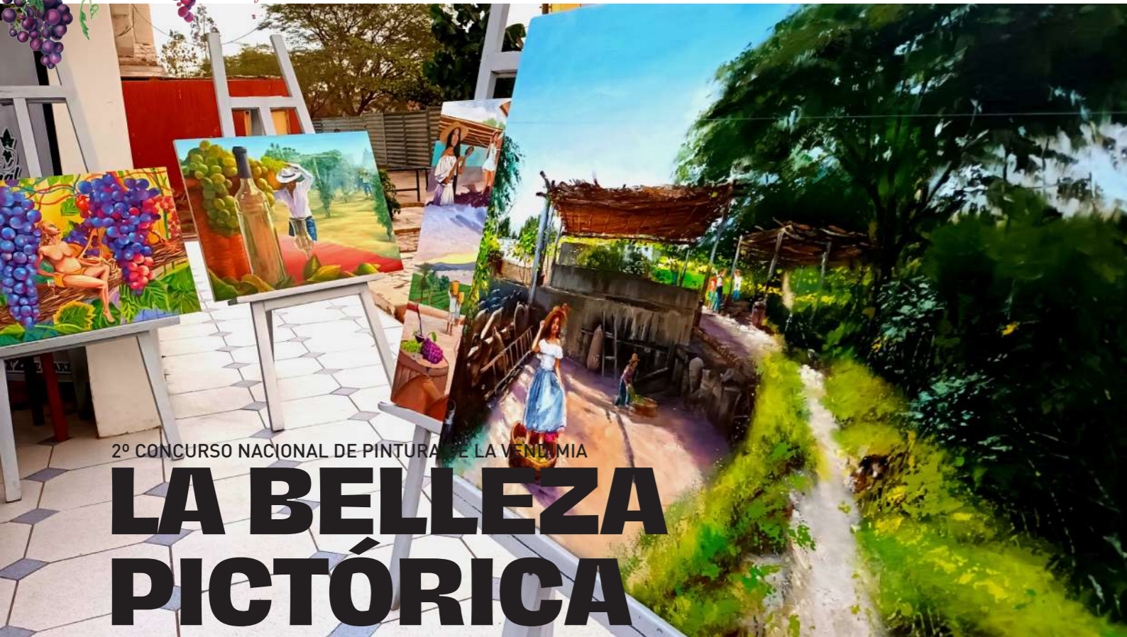
2° CONCURSO NACIONAL DE PINTURA DE LA VENDIMIA