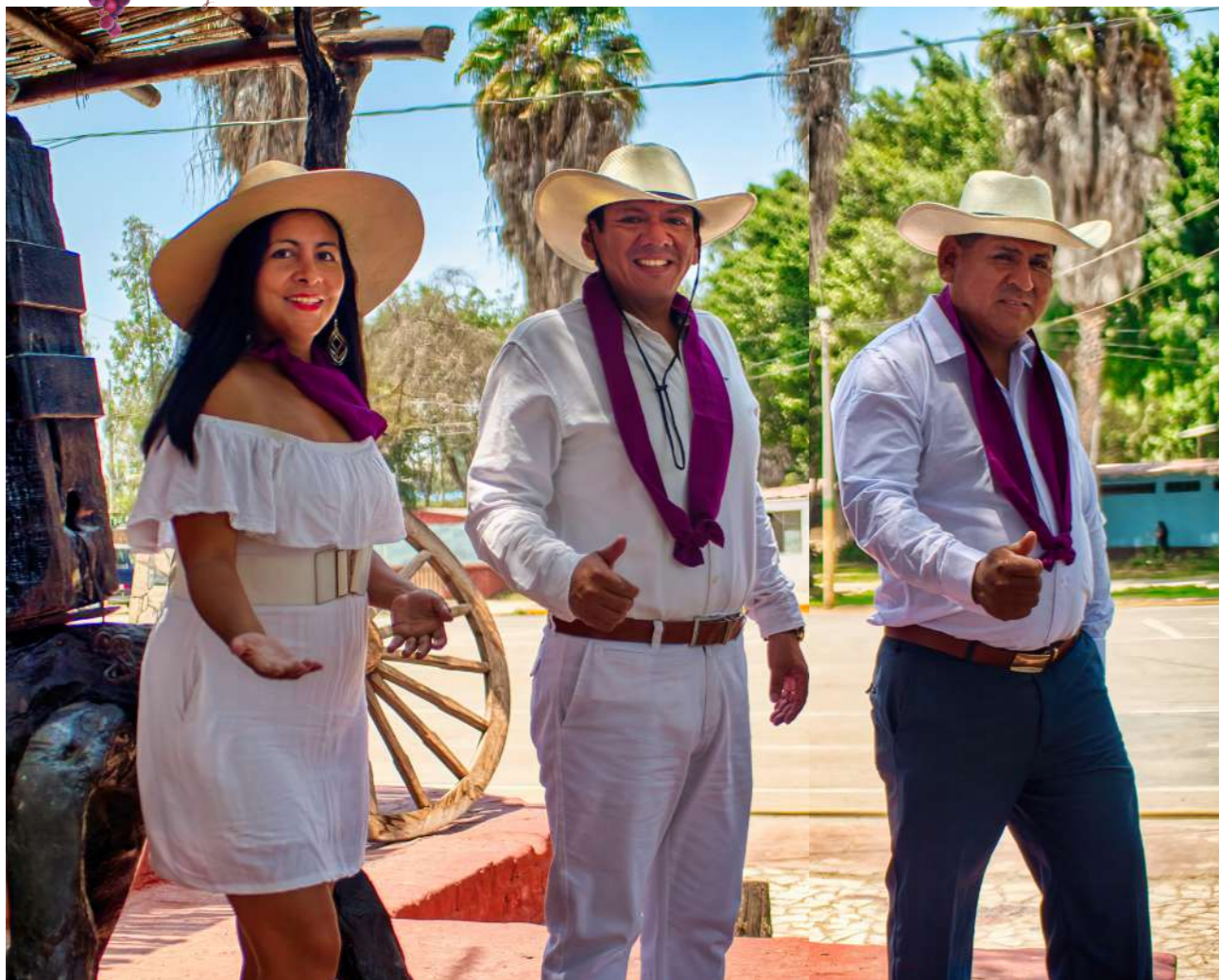
REGIDORES DE LA COMISIÓN DE ORGANIZACIÓN DE LA FIVI 2024